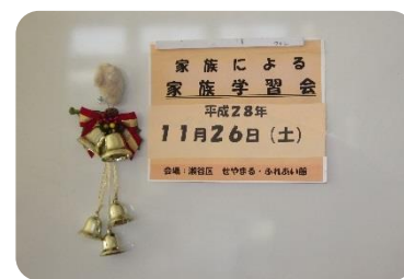
最終回には一足早くクリスマスリースが飾られました