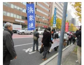
旗を持ってパレード

子どもの医療費無料にしてよ 貧困・格差で生活大変! 障がい者だって大変です 安心して住みやすい 神奈川県にしてください!