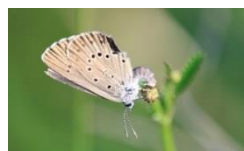
産卵中のゴマシジミ

目先の利害関係だけで成り立ちがちな社会をどうしたら「お互いが共生できる社会」の仕組みを作ることができるでしょうか・・・。ホモサピエンスの知恵が試される時ですね。